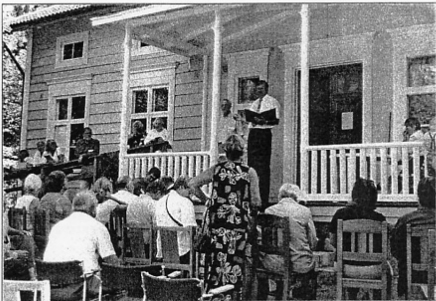
Det vackra vädret och det stora antalet deltagare medförde att informationen fick hållas från verandan på Höje skogsgård.

Dessförinnan hade den fjärde upplagan av släktöversikten, sammanställd