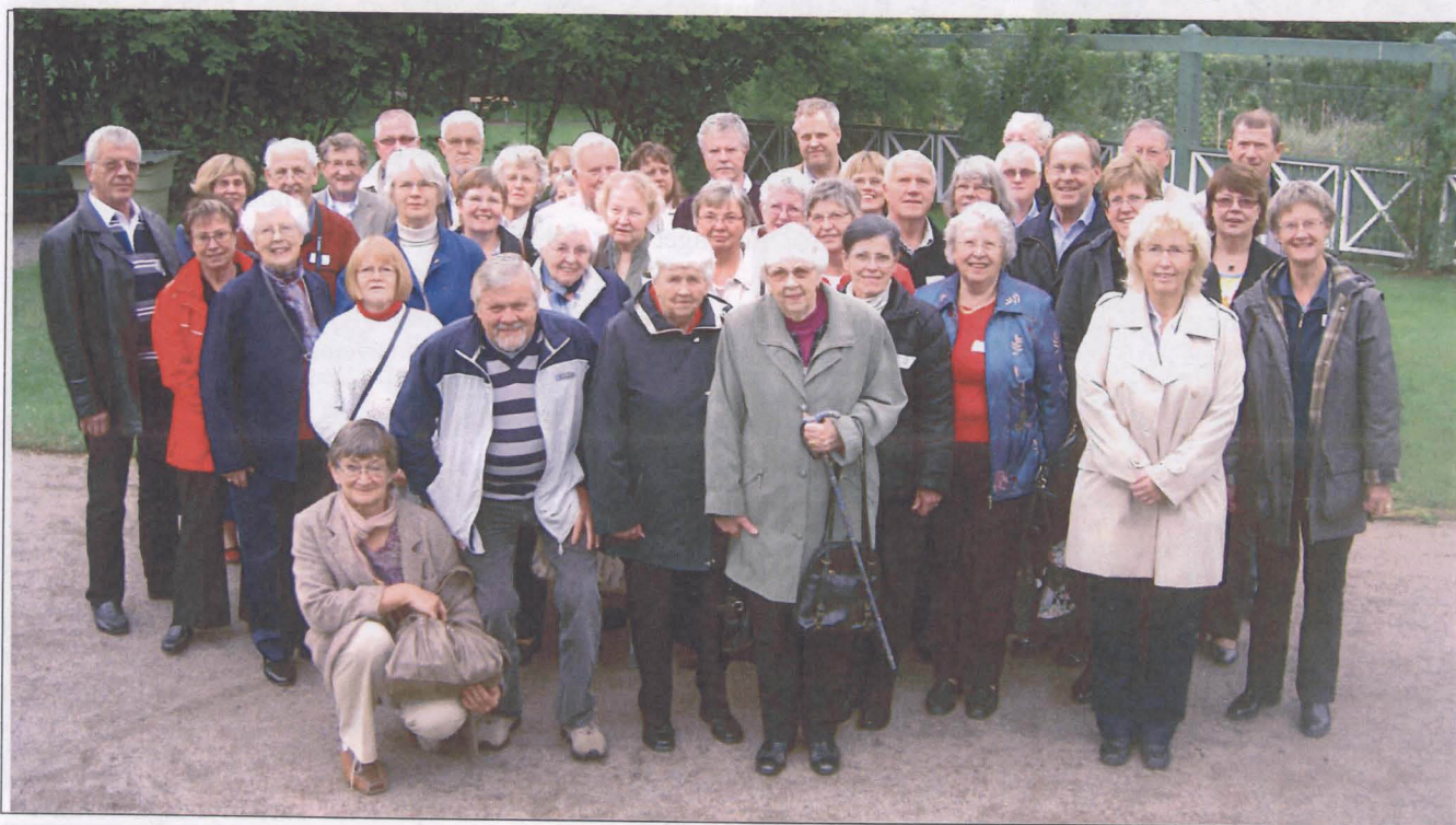
Deltagarna samlade för gruppfoto vid NaturCentrum i Trädgårdsföreningen i Linköping