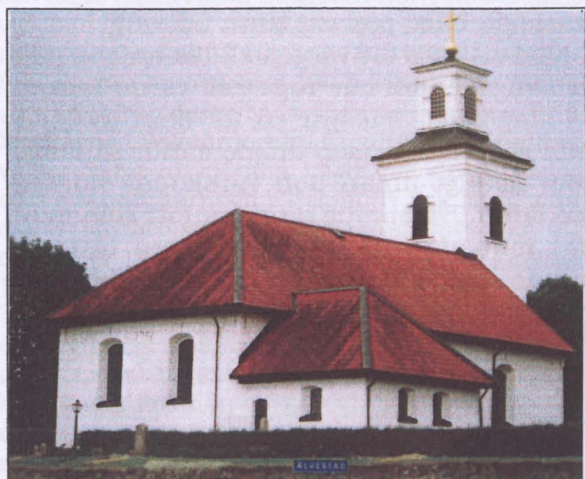
Kyrkan före branden

nedan visar kyrkan hur den såg ut före branden vårvintern 2007, efter branden och i det nyrenoverade skicket.