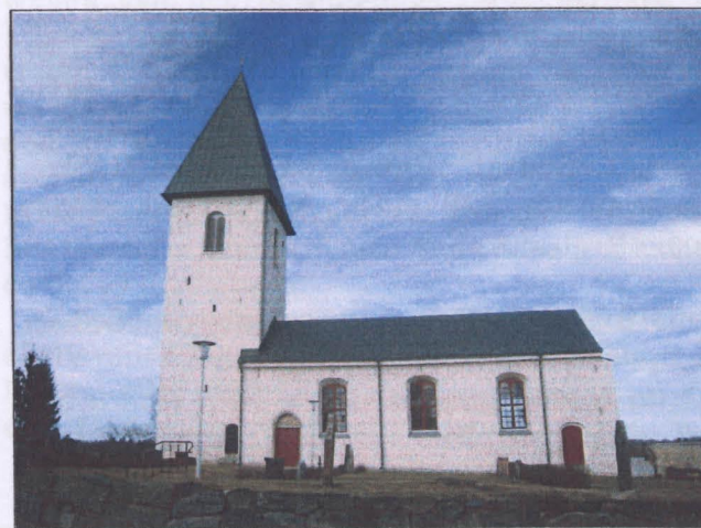
21 mars 2012