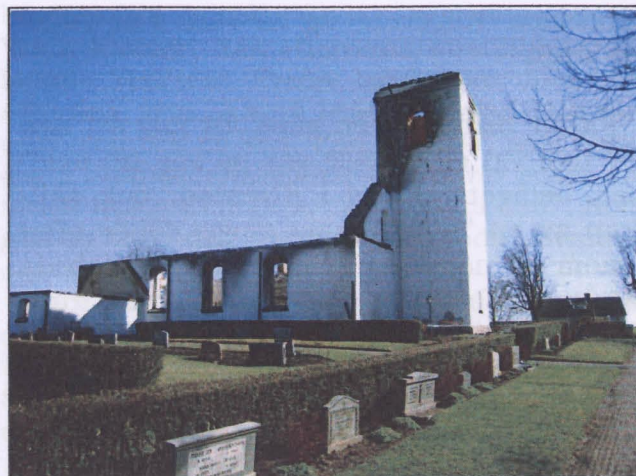
15 april 2007